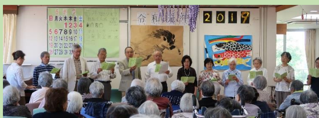
5月24日 さくらコーラス