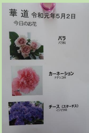
5月14日 フラワーアレンジメント